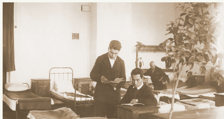
В общежитии (1936 г.)

Подготовительные группы Педтехникума (1927 г.)