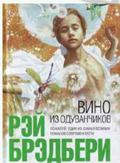
Рэй Брэдбери - «Вино из одуванчиков»

Одно из самых знаменитых (не считая «451 градус по Фаренгейту») произведений писателя. Повесть открывает читателю светлый и легкий мир двух мальчишек и погружает в историю одного лета, наполненного совершенно разными, радостными, загадочными и печальными историями, приключившимися с братьями, их родственниками, соседями, друзьями и просто жителями вымышленного городка Грин Таун. Рекомендовано всем, кто страдает от усталости и депрессий.