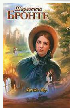
Шарлотта Бронте - «Джейн Эйр»

Одно из самых знаменитых (не считая «451 градус по Фаренгейту») произведений писателя. Повесть открывает читателю светлый и легкий мир двух мальчишек и погружает в историю одного лета, наполненного совершенно разными, радостными, загадочными и печальными историями, приключившимися с братьями, их родственниками, соседями, друзьями и просто жителями вымышленного городка Грин Таун. Рекомендовано всем, кто страдает от усталости и депрессий.