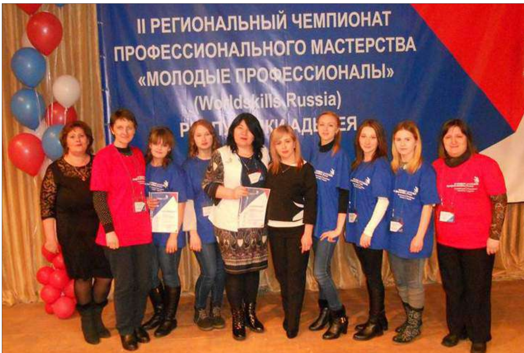
Эксперты и участники II Регионального чемпионата «Молодые профессионалы» Республики Адыгея

Республика Адыгея является ассоциированным членом движения WorldSkills Russia с 2016г. Чемпионат по стандартам WS «Молодые профессионалы» по компетенции «Дошкольное воспитание» в республике проходит уже второй раз.