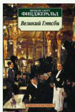
Фрэнсис Скотт Фицджеральд - «Великий Гэтсби»