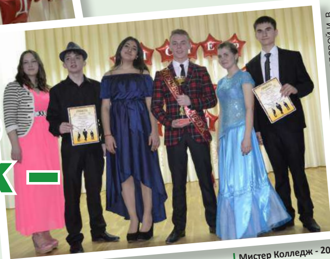
Мистер Колледж - 2017

21 февраля в стенах колледжа им. Х. Андрухаева прошло мероприятие под названием «Мистер Колледж - 2017». Конкурс был приурочен ко Дню защитника Отечества.