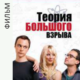
«ТЕОРИЯ БОЛЬШОГО ВЗРЫВА»

Роман был включен в список непризнанных на момент появления шедевров. Это поучительная история о превращениях и соблазнах, встающих на пути американской мечты, и о том, что несколько хороших и верных друзей гораздо важнее, чем их большое количество, а желание обладать гораздо слаще, чем само обладание.