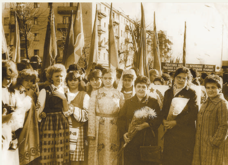
7 ноября (1985 г.)