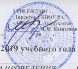
График организации учебного процесса в I семестре 2018 – 2019 учебного года